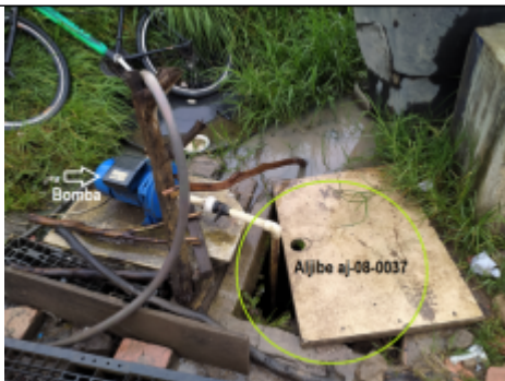
Foto No. 12. Vista general del aljibe

El aljibe aj-08-0037, está cubierto por una tapa de madera, sin embargo, está no es hermética y permite el ingreso de materiales contaminantes al recurso hídrico subterráneo, el área se encuentra con acumulación de vegetación, basuras y empozamiento de aguas lluvias con infiltración de esta al aljibe (ver foto No. 12 y 13).