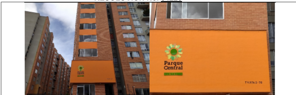
Foto No. 1. Vista general del Conjunto Residencial Tintal 3 (Tv. 97 A No. 2-70)