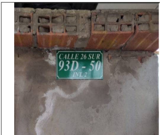
Foto No. 4. Dirección del parqueadero

Se evidencio en que el predio opera un parqueadero de vehículos con razón social CHÁVEZ MG, identificado con Nit. 40205176- 4, cerca de un bosque de reserva (ver foto No. 4 y 5).