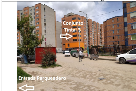
Foto No. 2. Ubicación del parqueadero