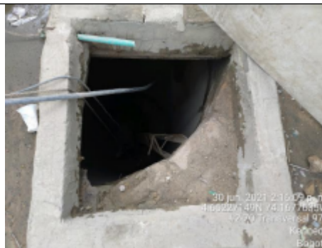
Foto No. 7. Vista al interior del aljibe