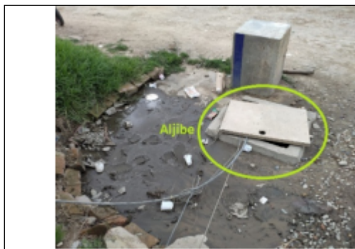
Foto No. 6. Vista general del aljibe

Durante la visita desarrollada, se visualizó que dentro del predio existe un aljibe de aproximadamente seis (6) metros de profundidad, ubicado al costado derecho de la entrada del predio (ver foto No. 6 y 7).