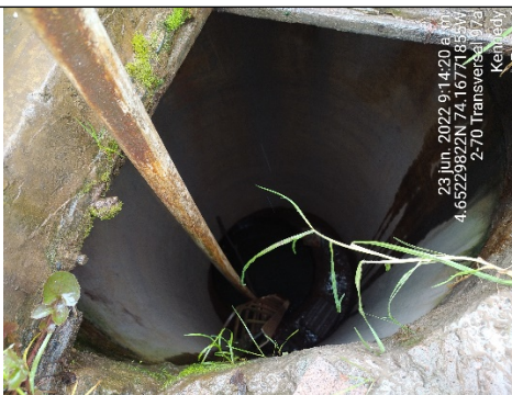
Foto No. 13. Vista al interior del aljibe

La extracción del recurso se realiza mediante compresor y electrobomba, y es transportada por manguera de 1/4" aproximadamente, hacia tanques de almacenamiento (ver foto No. 14 y 15), el agua extraída es para uso doméstico y lavado de vehículos, debido a que el predio no cuenta con red de acueducto ni alcantarillado; sin embargo, la red está disponible para que el usuario solicite la acometida.