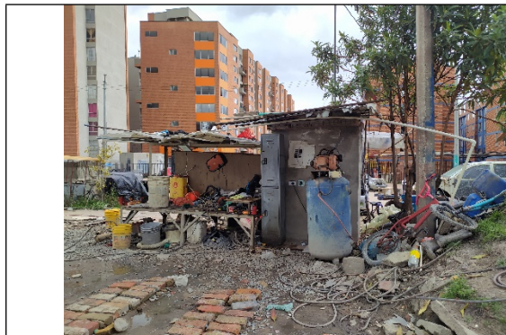
Foto No. 8. Compresor para extraer el agua subterránea