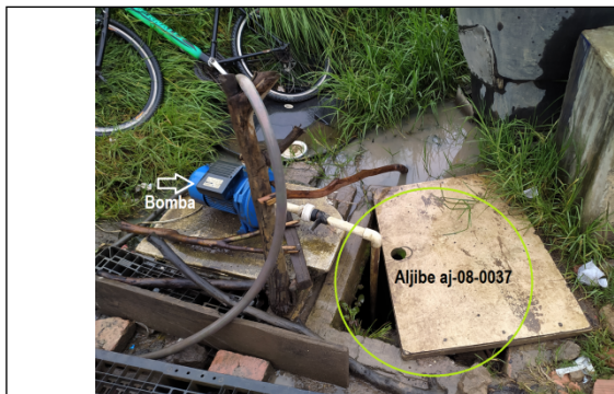
Foto No. 12. Vista general del aljibe

El aljibe aj-08-0037, está cubierto por una tapa de madera, sin embargo, está no es hermética y permite el ingreso de materiales contaminantes al recurso hídrico subterráneo, el área se encuentra con acumulación de vegetación, basuras y empozamiento de aguas lluvias con infiltración de esta al aljibe (ver foto No. 12 y 13).