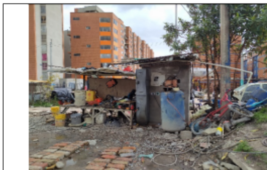
Foto No. 8. Compresor para extraer el agua subterránea