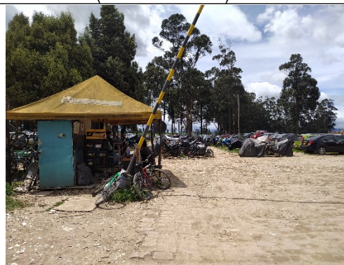
Foto No. 3. Vista entrada del parqueadero

Se evidencio en que el predio opera un parqueadero de vehiculos con razón social CHÁVEZ MG, identificado con Nit. 40205176-4, cerca de un bosque de reserva (ver foto No. 4 y 5).