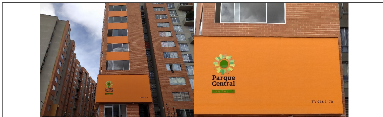
Foto No. 1. Vista general del Conjunto Residencial Tintal 3 (Tv. 97 A No. 2-70)

Se realizó visita al predio ubicado en la nomenclatura urbana Calle 26 Sur No. 93D - 50 Int. 2, en solicitud del Radicado 2021ER95258 de 18/05/2021, en el cual un Ciudadano manifestó que en frente del conjunto residencial parque central Tintal 3 (Transversal 97 a 2 - 70) en una zona verde, por medio de una moto bomba extraen agua subterránea y la utilizan para lavar carros y se lucran de este mismo ya que también lo utilizan como parqueadero (ver foto No. 1, 2 y 3).