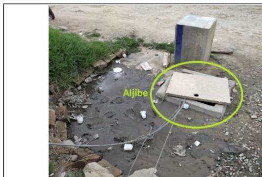
Foto No. 6. Vista general del aljibe

Durante la visita desarrollada, se visualizó que dentro del predio existe un aljibe de aproximadamente seis (6) metros de profundidad, ubicado al costado derecho de la entrada del predio (ver foto No. 6 y 7).