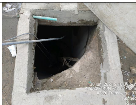
Foto No. 7. Vista al interior del aljibe