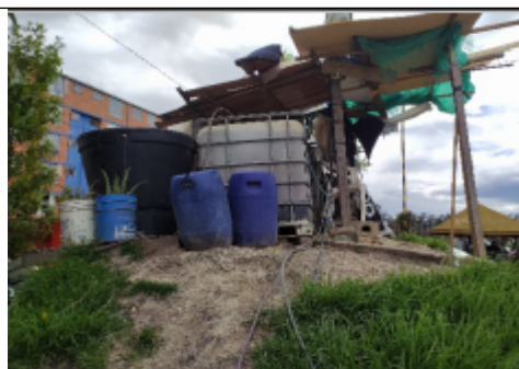
Foto No. 9. Tanques de almacenamiento

Las condiciones físicas y ambientales del aljibe son malas, no se encuentra delimitado, solo hay una tapa de madera encima de la captación, la extracción del recurso hídrico subterráneo se realiza de forma rústica, presentando amenaza para el recurso.