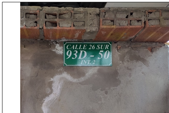
Foto No. 4. Dirección del parqueadero