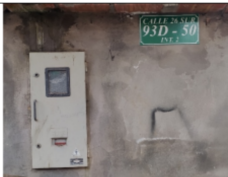
Foto No. 11. Dirección del parqueadero

El aljibe aj-08-0037, está cubierto por una tapa de madera, sin embargo, está no es hermética y permite el ingreso de materiales contaminantes al recurso hídrico subterráneo, el área se encuentra con acumulación de vegetación, basuras y empozamiento de aguas lluvias con infiltración de esta al aljibe (ver foto No. 12 y 13).