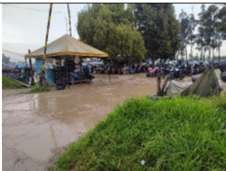
Foto No. 10. Vista entrada del parqueadero

Se realizó nuevamente visita al predio para verificar las condiciones actuales del aljibe, se evidenció que en el predio sigue operando el parqueadero de vehículos con razón social CHÁVEZ MG, identificado con Nit. 40205176-4 (ver foto No. 10 y 11), el cual sigue extrayendo el recurso hídrico subterráneo sin la debida concesión, se verificó en el sistema FOREST que no se ha allegó ninguna solicitud de concesión de aguas subterráneas.