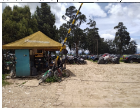
Foto No. 3. Vista entrada del parqueadero

Se evidencio en que el predio opera un parqueadero de vehículos con razón social CHÁVEZ MG, identificado con Nit. 40205176- 4, cerca de un bosque de reserva (ver foto No. 4 y 5).