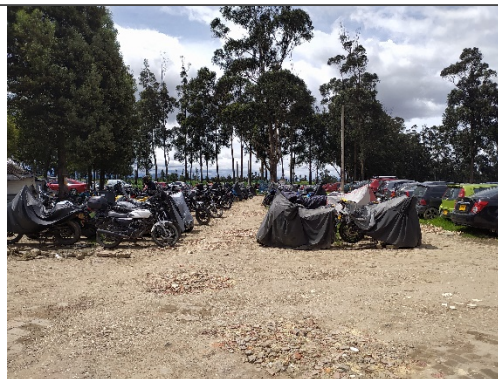
Foto No. 5. Vista al interior del parqueadero

Durante la visita desarrollada, se visualizó que dentro del predio existe un aljibe de aproximadamente seis (6) metros de profundidad, ubicado al costado derecho de la entrada del predio (ver foto No. 6 y 7).