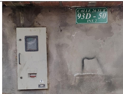
Foto No. 11. Dirección del parqueadero

El aljibe aj-08-0037, está cubierto por una tapa de madera, sin embargo, está no es hermética y permite el ingreso de materiales contaminantes al recurso hídrico subterráneo, el área se encuentra con acumulación de vegetación, basuras y empozamiento de aguas lluvias con infiltración de esta al aljibe (ver foto No. 12 y 13).