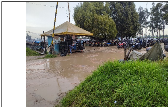
Foto No. 10. Vista entrada del parqueadero