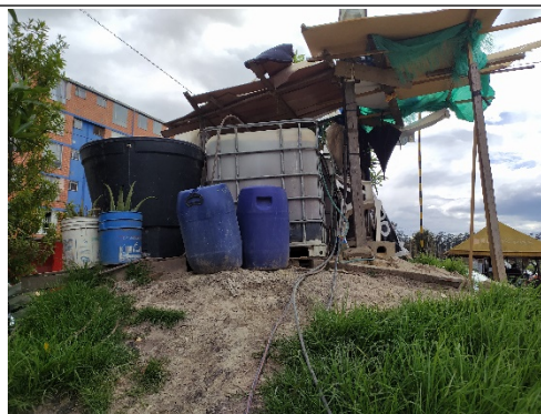
Foto No. 9. Tanques de almacenamiento

Las condiciones físicas y ambientales del aljibe son malas, no se encuentra delimitado, solo hay una tapa de madera encima de la captación, la extracción del recurso hídrico subterráneo se realiza de forma rustica, presentando amenaza para el recurso.