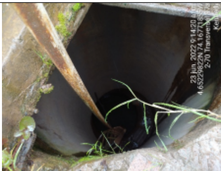
Foto No. 13. Vista al interior del aljibe