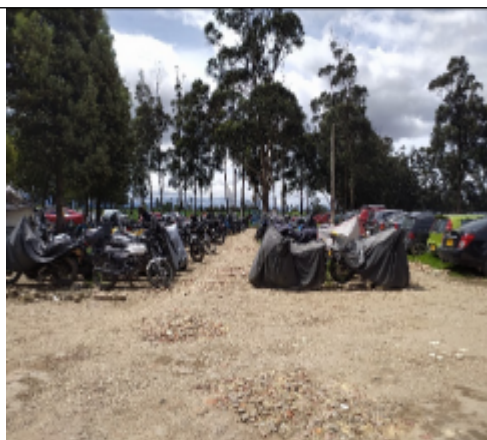
Foto No. 5. Vista al interior del parqueadero